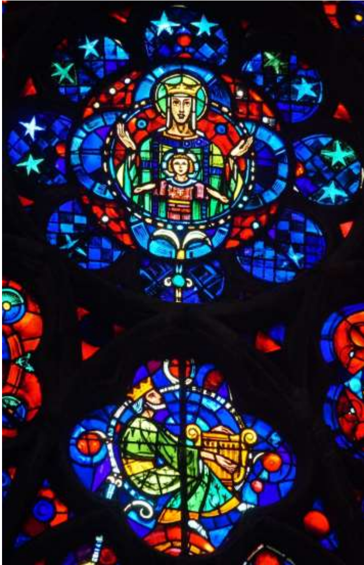
Detail aus einem Glasfenster der Kathedrale in Reims