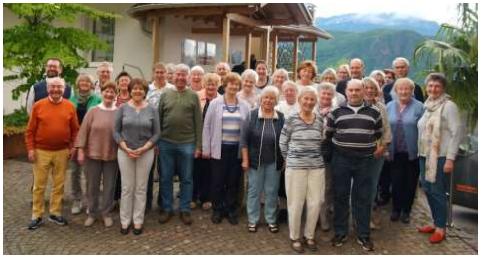
Die Reisegruppe vorm Hotel in Leifers, Bozen

Um besser planen zu können, bitten wir um eine Anmeldung im Pfarrbüro bis Dienstag, 16. Juli.