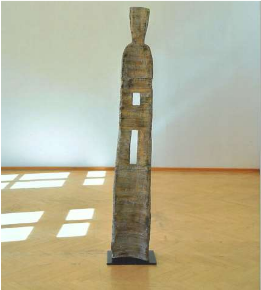
Michaela Geissler, „Durchblick“ (Rechte bei der Künstlerin)